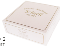
Motiv 2 modern