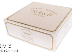
Motiv 3 traditionell