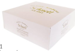
Motiv 1 ohne Umrandung