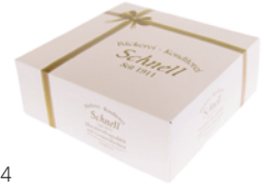
Motiv 4 mit Schleife